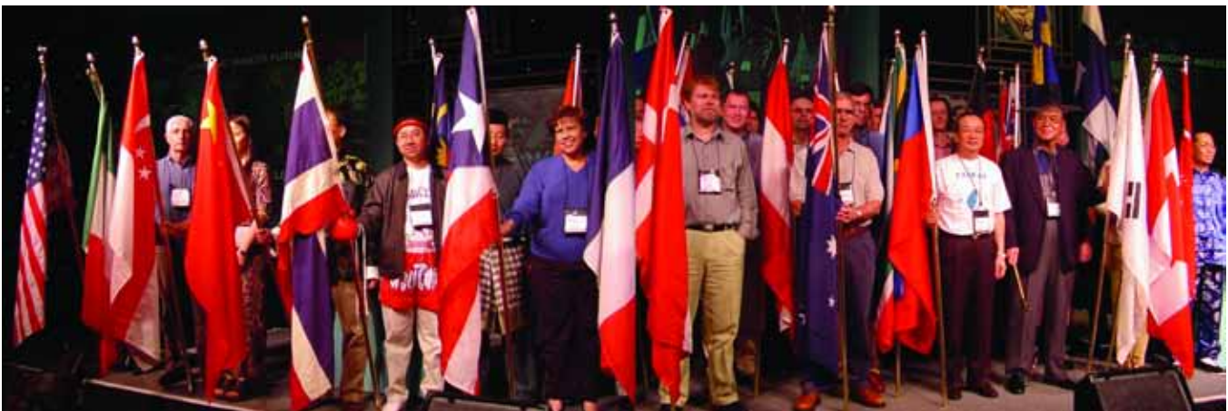
טקס הנפת הדגלים במפגש המנהלים הגלובלי של אבנט בשנת 2000, שבו השתתפו 700 מנהיגים מכל רחבי העולם.

בנוסף, בכפוף לחוק האמריקאי ולחקיקה במדינות נוספות, אסור לנו לשתף פעולה עם בקשות להשתתף בחרמות או בהתנהלות סחר מגבילה אחרת שאינה מוטלת מכוח החוק. פירוש הדבר, בחלקו, הוא שאסור לנו לנקוט פעולה, לספק מידע או לצאת בהצהרה העלולה להיחשב כשיתוף פעולה עם חרם לא-חוקי. הפרת חוקים אלה גוררת עימה קנסות ועונשים כבדים. אם אתם סבורים שקיבלתם בקשה ישירה או עקיפה להשתתף בחרם לא חוקי, אתם נדרשים ליצור קשר עם המחלקה המשפטית ולקבל הנחיות. על החברה שלנו לדווח על כל הבקשות לחרם לממשלת ארה"ב, ולכן חיוני שתפעלו על פי מדיניות זו בקפידה.