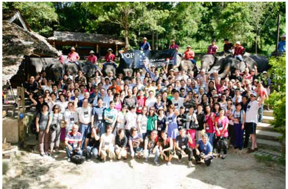
כנס המנהיגות של Avnet Technology Solutions Asia, המסתמך על הידע, התרבות ועבודת הצוות של החברה.