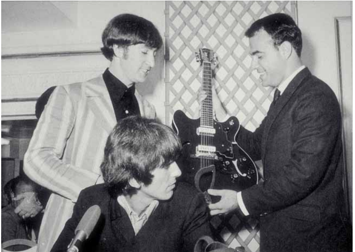
בשנת 1965 רכשה אבנט את Guild Musical Instruments, וכך יכלה החברה להעניק את גיטרת Guild Starfire 12 לג'ון לנון ולג'ורג' האריסון.