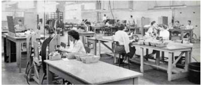
במפעל של אבנט להרכבת מחברים, 1959.

תרבות מגוונת של רקעים, חוויות ורעיונות שונים. באבנט, אנו מבססים את החלטות ההעסקה שלנו על מעלות, ניסיון וקריטריונים אחרים הקשורים לעבודה. אנו לא מפלים איש על בסיס גזע, צבע, מוצא, מין, מצב משפחתי, דת, גיל, מוגבלות נפשית או גופנית, מצב רפואי, נטייה מינית, רקע צבאי או כל תכונה אחרת המוגנת בחוק.