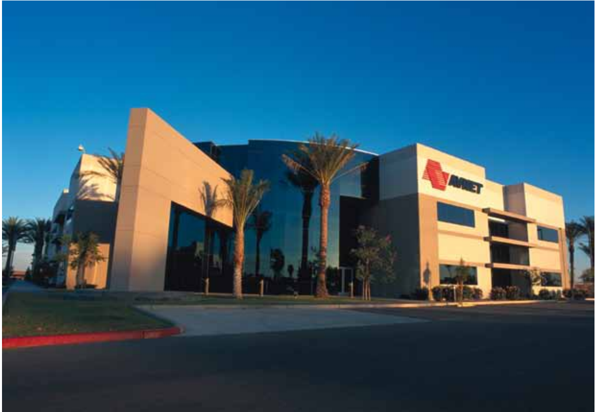
בשנת 1998 הקימה אבנט את משרדיה הראשיים בפניקס, אריזונה.