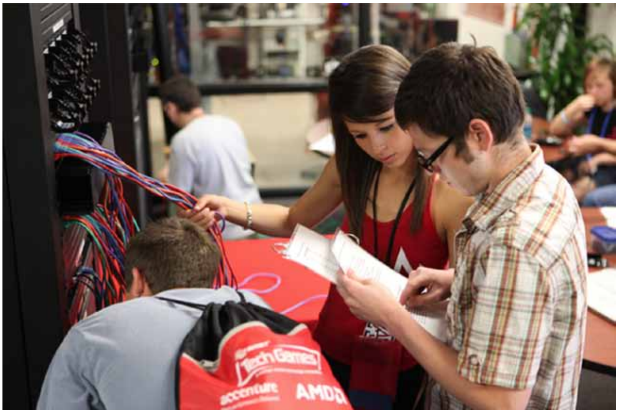
סטודנטים המתחרים בתחרויות הטכנולוגיות של אבנט.

מוטלת עלינו החובה להימנע מכל מצב שבו האינטרסים האישיים שלנו יעמדו בסתירה לאלה של החברה. ניגודי אינטרסים כאלה יכולים לקרות כאשר פעילות, השפעה או מערכת יחסים מחוץ לחברה משפיעה על יכולתנו לפעול על פי האינטרסים של אבנט. ניגודי אינטרסים כאלה יכולים גם להתעורר כשאנו מנצלים את העמדה שלנו באבנט להשגת רווח אישי, או עבור חבר או בן משפחה.