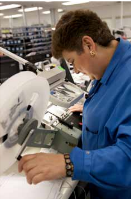
אבנט מתכנתת יותר מוליכים-למחצה מכל חברה אחרת – למעלה מ-300 מיליון כאלה בשנה.

תשובה: כן. המידע הזה נחשב כמידע החסוי מעיני הציבור ואף עשוי להיחשב סודי. לכן, כל מסירת מידע - גם אם נמחקה בדיעבד - עשויה להיות מכרעת עבור החברה שלנו וקשרינו עם שותפינו העסקיים. עליך להודיע למנהל שלכם או למחלקה המשפטית על ההודעה בשגגה על מנת להבטיח שאבנט תוכל להתכונן לתגובה במידת הצורך.