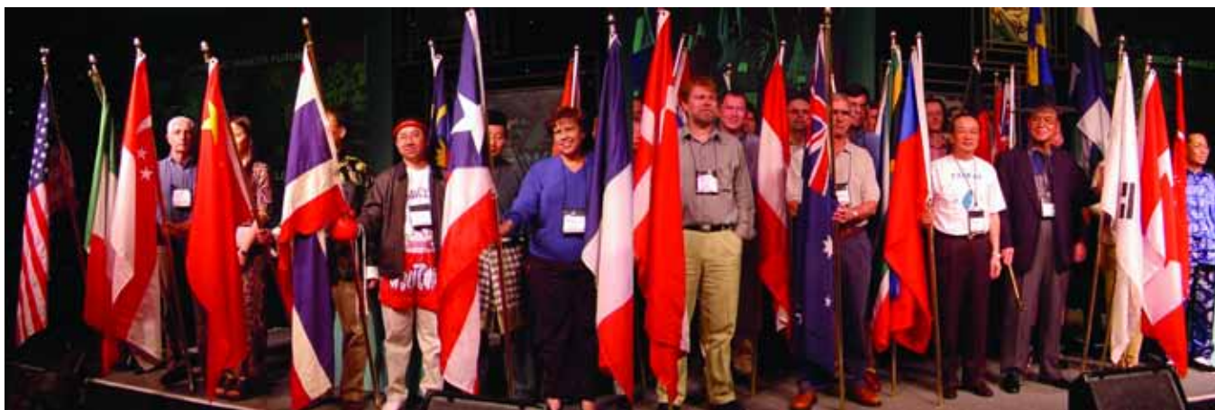
Cérémonie du drapeau à l'ouverture de la réunion internationale des dirigeants d'Avnet en 2000 où se sont rassemblés 700 dirigeants du monde entier.

En outre, en vertu des lois en vigueur aux Etats-Unis et des législations de nombreux autres pays, nous ne devons pas coopérer aux demandes de participer à des boycotts ou à toutes autres pratiques commerciales restrictives qui n'ont pas été autorisés par la loi. Cela signifie, notamment, que nous ne pouvons pas prendre des mesures, fournir des informations ou faire des déclarations qui pourraient être considérées comme une participation à un boycott illégal. Il existe des sanctions sévères en cas de violation de ces lois. Si vous pensez avoir reçu directement ou indirectement une demande de participer à un boycott illégal, vous devez demander conseil au service juridique. Notre société doit signaler toutes les demandes de boycott au gouvernement des États-Unis, il est donc essentiel que vous respectiez cette politique.