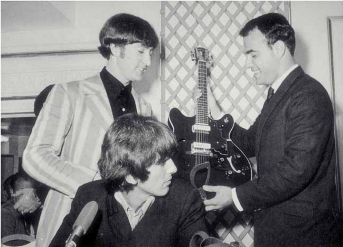
Avnet a acquis Guild Musical Instruments en 1965, ce qui a conduit Avnet à présenter une Guild Starfire 12 aux membres des Beatles, John Lennon et George Harrison.

Il existe une exception générale pour les petites quantités d'actions, d'obligations et autres titres émis par une société publique. Dans ce cas, un « petit montant » signifie moins d'un pourcent de la valeur de la société. Dans les autres cas, le comité d'éthique et de conformité de la société doit approuver les exceptions par écrit.