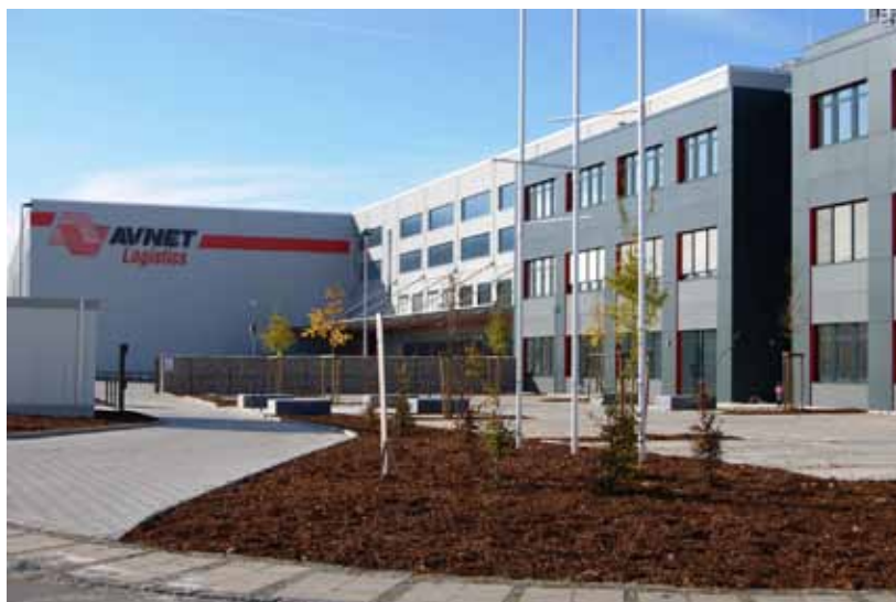
Nouvel entrepôt automatisé d'Avnet à Poing, Allemagne.

De la même manière que nous sommes encouragés à nous investir dans nos communautés en contribuant à des œuvres de bienfaisance, notre société soutient notre droit à participer à des activités politiques. Cependant, veuillez noter que nous pouvons uniquement participer à de telles activités sur notre temps libre et à nos propres frais. Nous ne devons jamais utiliser les biens, les locaux, le temps ou les fonds d'Avnet pour des activités politiques. De même, vous ne devez jamais vous attendre à être remboursé – directement ou indirectement – pour toute contribution politique. Pour toute question, veuillez demander conseil au service juridique.