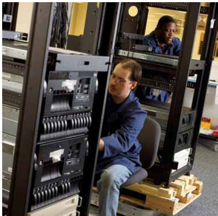
Le centre de solutions Avnet Global Solutions Center a la capacité d'intégrer et d'expédier plus de 700 000 systèmes par an.

R : Non. Vous devez uniquement faire des déclarations totalement sincères et vraies lorsque vous négociez avec nos clients, nos fournisseurs ou autres partenaires commerciaux. Cela inclut toutes les déclarations ou promesses verbales que nous faisons. Vous devez dire à ce client que, bien que nous soyons convaincus de la qualité de nos produits, nous ne pouvons pas inclure une telle garantie dans nos contrats. Rassurez ce client en lui disant qu'en cas de défaut, Avnet gèrera la situation de manière appropriée. Ne promettez jamais oralement une chose que vous ne pourriez pas inclure dans un contrat.