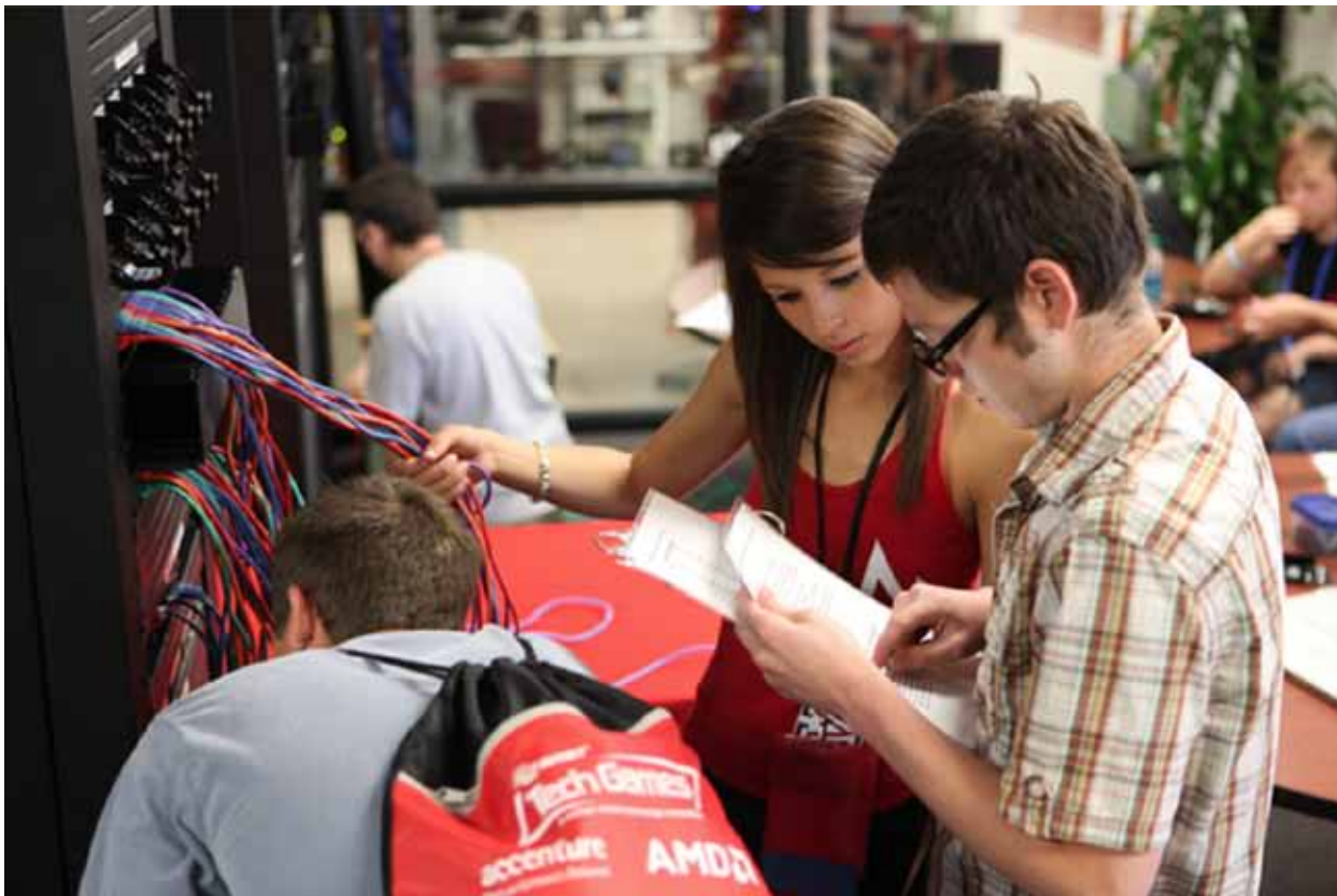
Des universitaires participant au tournoi Avnet Tech Games.

Les sections suivantes décrivent certaines des situations courantes susceptibles de créer un conflit d'intérêts. N'oubliez pas qu'il ne s'agit que d'exemples généraux. Vous pouvez être amené à rencontrer d'autres conflits d'intérêts.