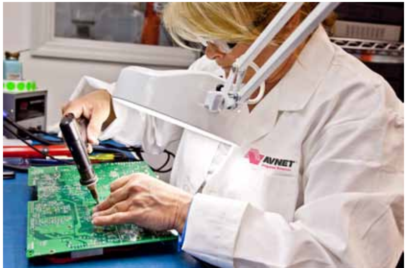
Technicienne réparatrice de l'usine d'Avnet Integrated Resources, à Columbus, Ohio, spécialisée dans le secteur de la télévision par câble.

Il est important que nous protégeons la confidentialité de ces informations à tout moment. Les informations confidentielles doivent être communiquées uniquement aux collègues qui ont besoin d'y avoir accès pour des raisons professionnelles ou tel que requis par la loi. Nous ne devons pas tenter d'utiliser des informations confidentielles et propriétaires à des fins personnelles et nous ne devons pas divulguer des informations confidentielles, sensibles ou non publiques aux personnes externes à la société. Cela implique d'être particulièrement vigilants et de nous assurer que personne ne puisse entendre notre conversation lorsque nous discutons de ces informations dans des lieux publics, tels que les trains, les aéroports, les restaurants ou les espaces détente.