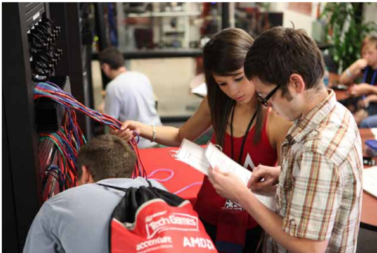
Estudantes universitários competem nos jogos Avnet Tech Games.

As seguintes seções descrevem algumas situações comuns que podem criar um conflito de interesses. Tenha em mente que estes são exemplos gerais. Eles não são os únicos conflitos possíveis que você pode enfrentar.