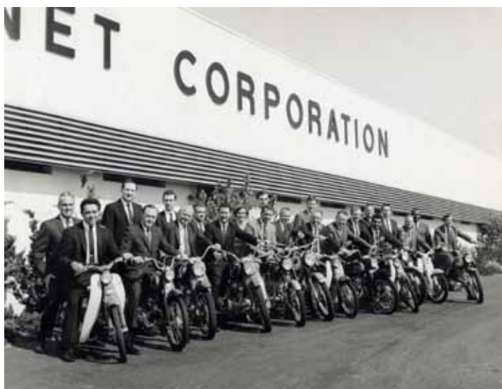
As equipes de Los Angeles e Orange County, Califórnia, EUA da Avnet se reúnem para uma promoção de vendas em 1968.

Para manter nossa integridade, é importante que tenhamos uma comunicação clara e consistente com o público sobre o status financeiro e os planos da Avnet. Nossas interações com os membros da mídia de notícias e a comunidade de investimentos devem refletir de modo preciso os objetivos e as condições de nossa empresa. Portanto, você nunca deve fazer declarações públicas em nome da Avnet, a não ser que esteja especificamente autorizado a fazê-lo. Se você receber uma solicitação de um investidor, analista de ações, imprensa ou outro contato público chave, de modo formal ou informal, encaminhe a pessoa ao departamento de relações com o investidor ou relações públicas. Solicitações de executivos do governo ou advogados devem ser encaminhadas ao departamento jurídico.