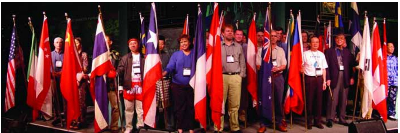
Cerimônia da bandeira abre a reunião de gerentes globais em 2000 onde se reuniram 700 líderes de todo o mundo.

E também, sob as leis dos EUA e a legislação de diversos outros países, não devemos cooperar com solicitações para participar de boicotes ou outras práticas comerciais restritivas não aprovadas por lei. Isso significa, em parte, que não podemos tomar qualquer medida, fornecer qualquer informação ou fazer declarações que poderiam ser consideradas cooperação com um boicote ilegal. Há penalidades severas pela violação dessas leis. Se acreditar ter recebido uma solicitação direta ou indireta para participar de um boicote ilegal, você deve entrar em contato com o departamento jurídico para orientação. Nossa empresa deve comunicar todos os pedidos de boicote ao governo dos EUA, portanto, é crucial que você cumpra esta política.