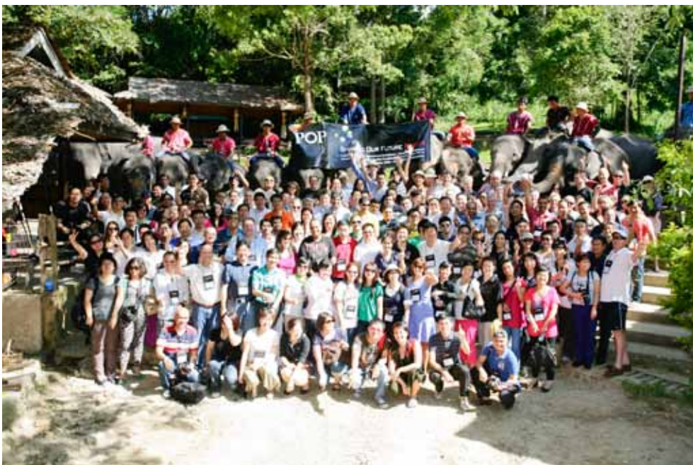
Conferência de líderes da Avnet Technology Solutions Asia, construindo o futuro a partir do seu conhecimento, cultura e trabalho em equipe.

A Avnet deve operar em total conformidade com as leis, regras e regulamentos das localidades onde fazemos negócios. Muitas dessas leis são complexas e podem mudar com o tempo, variando entre países. Se você tiver dúvidas sobre uma lei ou regulamento em especial ou sobre como ela se aplica ao seu trabalho na Avnet, entre em contato com seu gerente ou com o departamento jurídico.