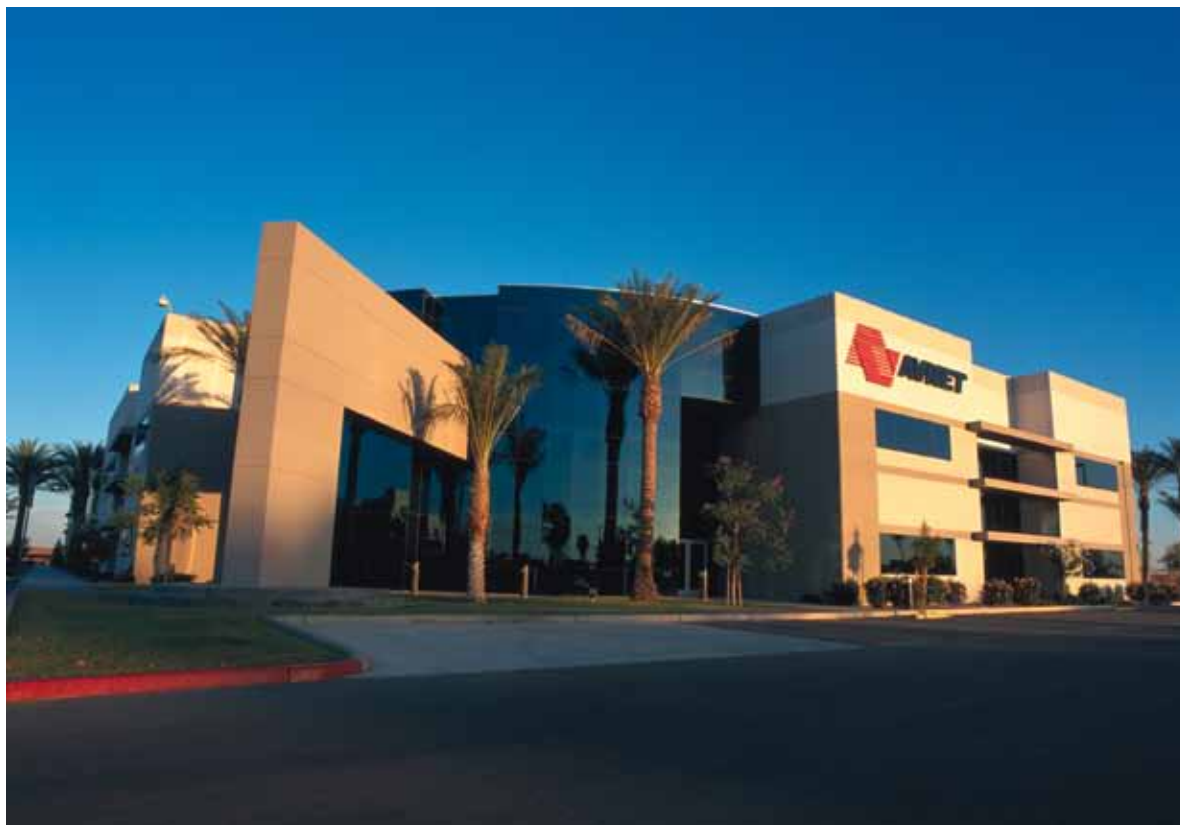
A Avnet estabeleceu sua sede corporativa em Phoenix, Arizona - EUA, em 1998.