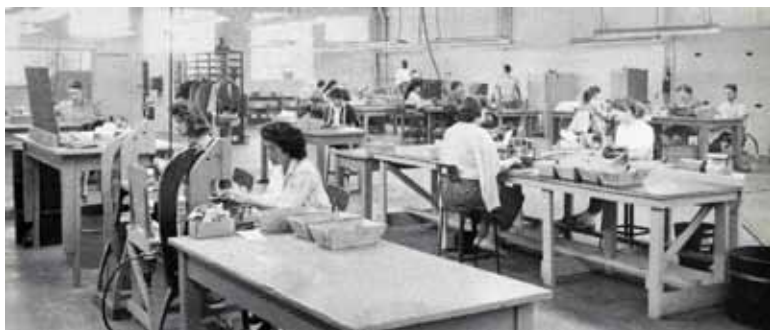
Operação de montagem de um conector Avnet em 1959.

Na Avnet, acreditamos que trabalhamos melhor em uma atmosfera de justiça, cooperação e oportunidades iguais. Como empregados, estamos assim comprometidos a respeitar a dignidade de cada indivíduo. Todos nós devemos nos conduzir de maneira madura, responsável, profissional e respeitosa. Além disso, todos nós devemos compartilhar a responsabilidade de manter um local de trabalho seguro, digno e produtivo.