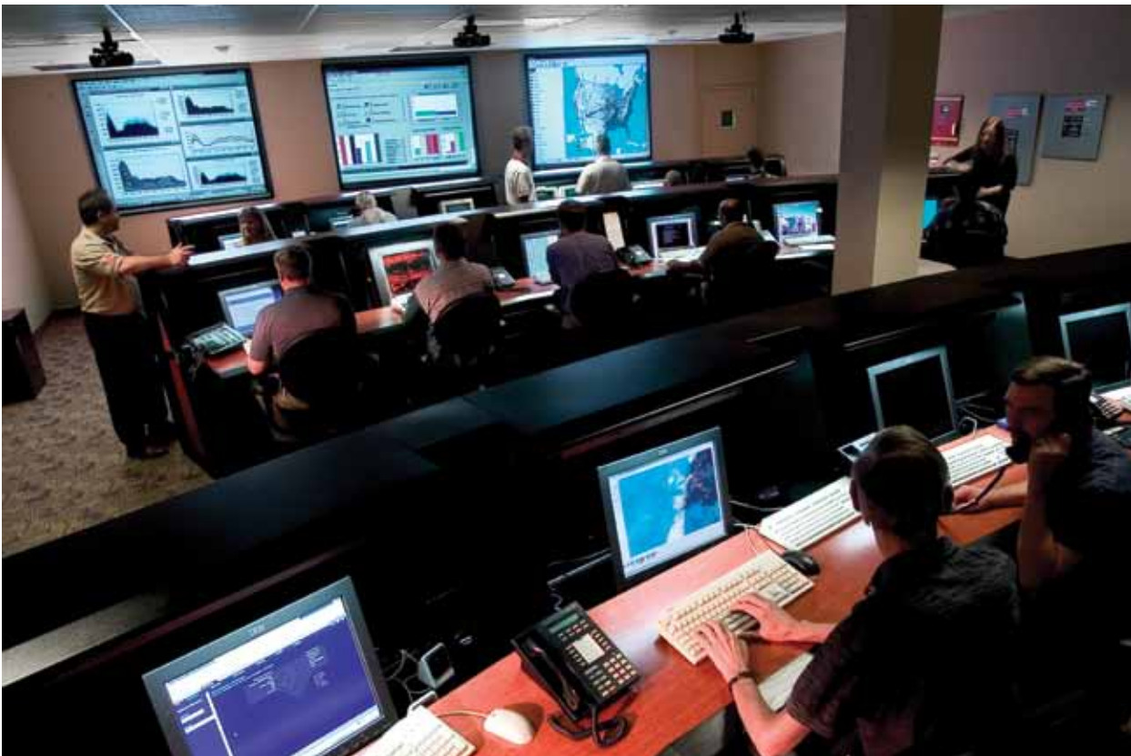
A sala de controle de TI global em Chandler, Arizona, EUA, é o coração de nossas comunicações, armazenamento de dados e atividades de negócios com clientes e fornecedores.

Aqueles de nós cujas obrigações envolverem operações internacionais devem estar familiarizados com as leis e regulamentos de exportação e importação pertinentes que se apliquem a nossas funções. Também devemos nos familiarizar com as políticas de conformidade de comércio internacional de nossa empresa e cumpri-las. As políticas da Avnet que regem a conformidade com o comércio internacional estão localizadas na intranet . As leis e os regulamentos de exportação e importação podem ser complexos; quando em dúvida, entre em contato com o departamento jurídico.