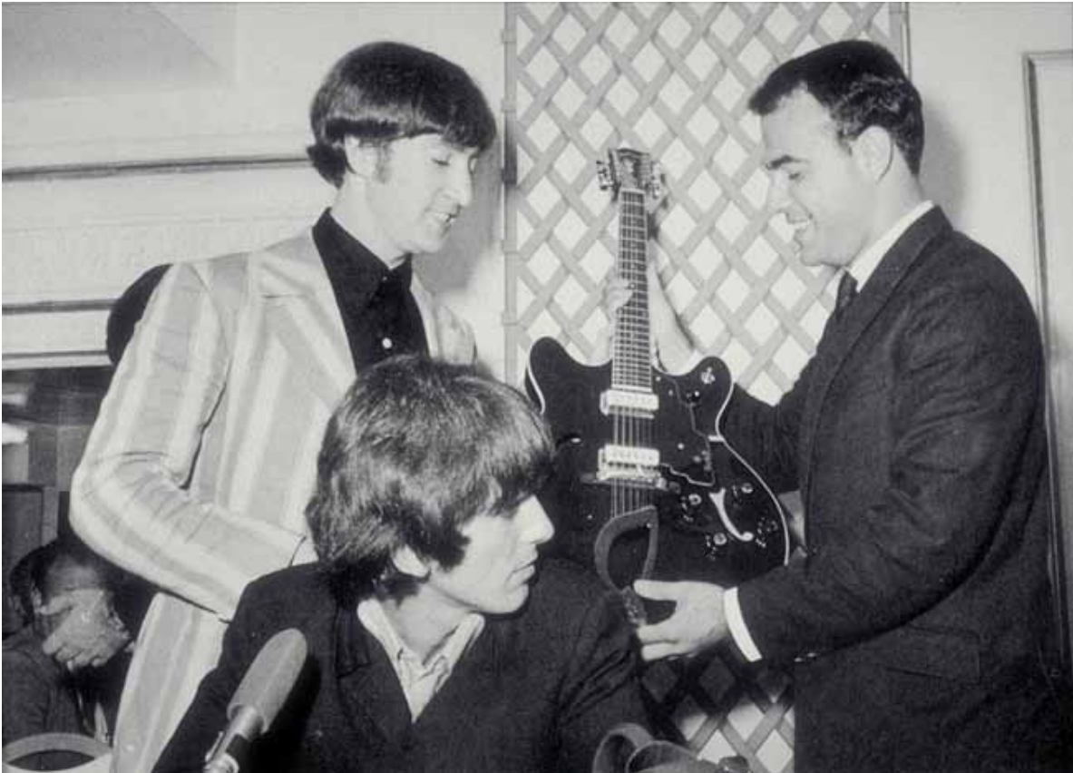
A Avnet adquiriu a Guild Musical Instruments em 1965, o que levou a Avnet a presentear uma Guild Starfire 12 aos Beatles John Lennon e George Harrison.

De modo geral, é feita uma exceção para pequenos valores de ações, títulos ou outros papéis emitidos por uma corporação de capital aberto. Neste caso, “um pequeno valor” significa menos de um por cento do valor da empresa. Caso contrário, o comitê de ética e conformidade corporativo deve aprovar as exceções por escrito.